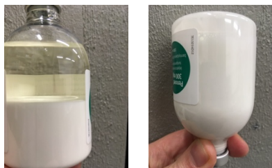
Flaskan före och efter omskakning